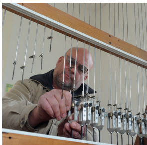
Le restaurateur à l'ouvrage

Encore, une bonne nouvelle : le Carillon, de retour de restauration ces jours-ci est à nouveau en place, pour faire entendre le son joyeux de ses cloches sous les mains expertes de notre carillon-