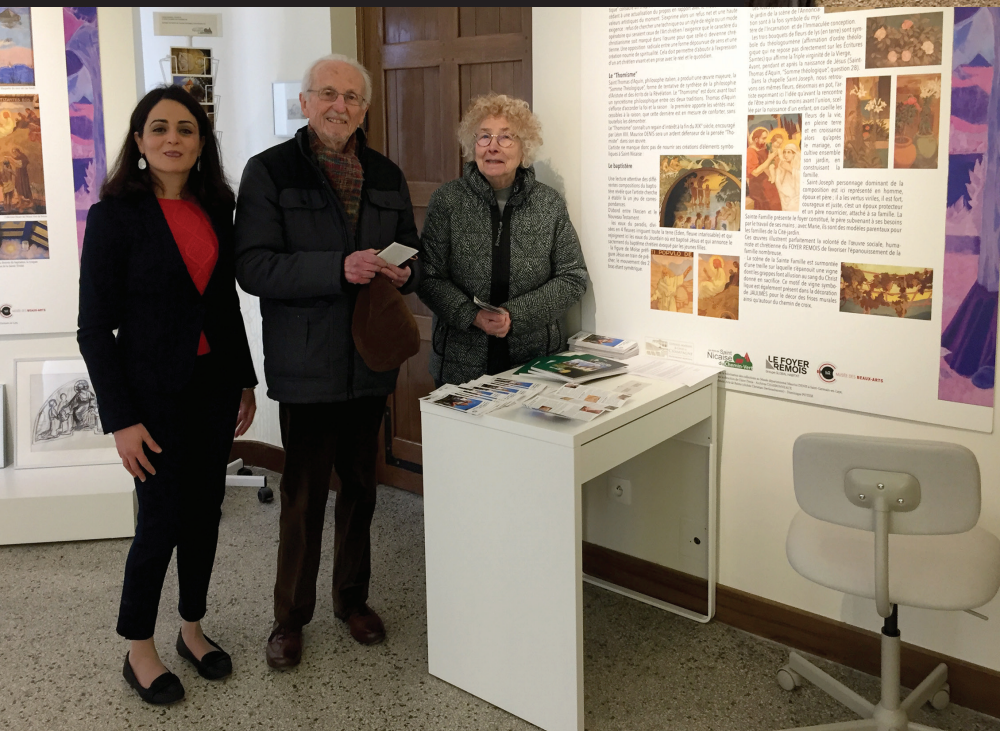
Le samedi 13 avril, Sofia accueille nos premiers visiteurs, membres des "Amis de Saint-Nicaise du Chemin-Vert".

Une signalétique a été mise en place pour faciliter l'accueil des visiteurs et permettre un accès aisé à tous, y compris handicapé, par le côté droit de l'église, directement vers l'Espace J.M. AUBURTIN.