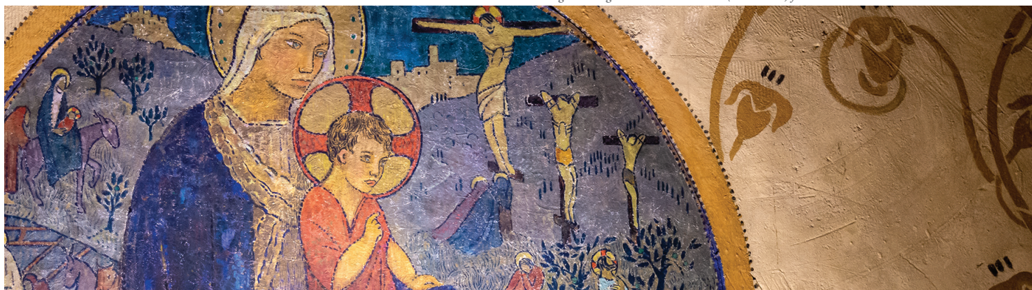
Détail du "tondo" réalisé par Jean BERQUE pour la décoration de la chapelle en bois édifée pendant la durée du chantier

Hommage à Georges CHARBONNEAUX (1865-1933) fondateur du FOYER REMOIS